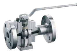
2 pièces arbré INTEC K230/K231