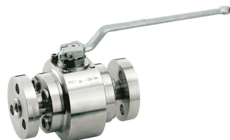
Haute-pression : INTEC K800