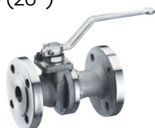
2 pièces INTEC K200