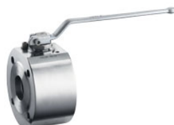
Compacte INTEC K200-K