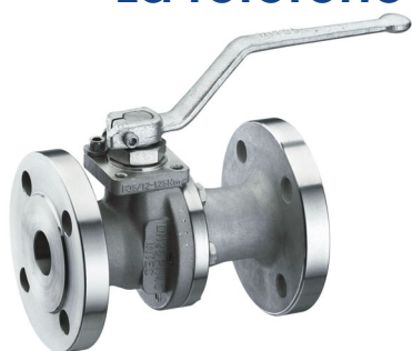
2 pièces : INTEC K200

La référence Allemande enfin disponible en France !