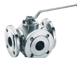
Multi-voies INTEC K400