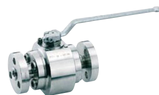
3 pièces haute-pression INTEC K800

Nos experts sont à votre service, n'hésitez pas à les contacter !