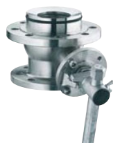
Fond de cuve INTEC K500